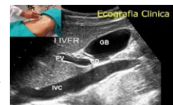
LA GUIDA ALLA "VISITA" ECOGRAFICA